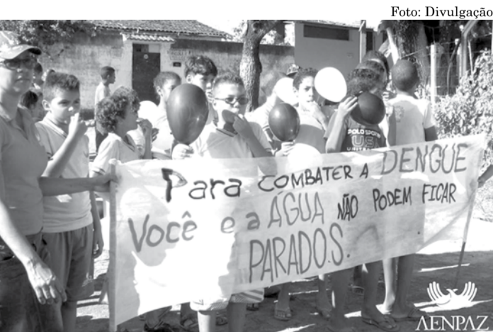
CONSCIENTIZAÇÃO Alunos da AENPAZ na passeata

No último dia 27 de junho, o Projeto Novas de Paz, em Abreu e Lima-PE, promoveu uma passeata com a finalidade de chamar a atenção dos moradores do bairro do Planalto para combater o mosquito transmissor da Dengue.