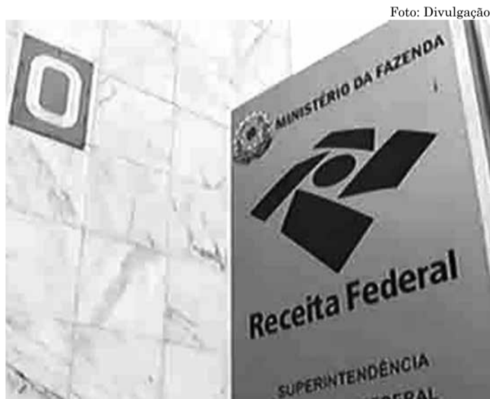
RECEITA FEDERAL deu o prazo até o próximo dia 05 de julho

Quem questiona na Justiça alguma dívida com a Previdência ou a Receita terá de desistir do processo para aderir ao refinanciamento. As empresas terão um benefício adicional e poderão abater créditos tributários (recursos que têm direito a receber do Fisco) e prejuízos de anos anteriores do saldo remanescente das dívidas. Nesse caso, as perdas preci-