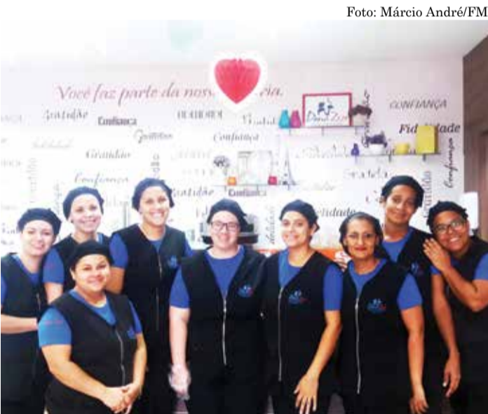
EQUIPE Atendimento é um diferencial dos colaboradores

A competitividade comercial e empresarial é uma marca importante a ser conquistada entre aqueles que querem fidelizar e ampliar o seu leque de clientes no mercado. Além da competitividade, é necessário investir na qualidade dos serviços, principalmente no atendimento humano. A Padaria Dona Zizi tem essas características: competitividade, qualidades nos seus produtos e, sobretudo, um atendimento diferenciado dos colaboradores que trabalham na empresa.