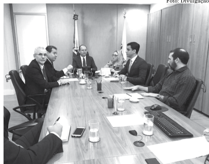
AÇÃO Ninho pede a União recursos destinados à saúde

“A reunião foi positiva, o ministro se mostrou sensível com o nosso pleito. A população das cidades atingidas pela chuva está sofrendo muito; a resposta precisa ser rápida. E a liberação das emendas já é um