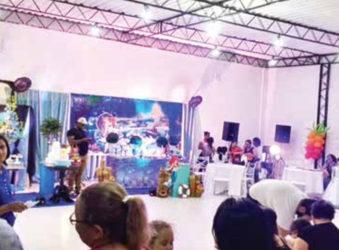
INAUGURAÇÃO O espaço foi aberto aos clientes e parceiros

Foi inaugurado, no último dia 22 de setembro,