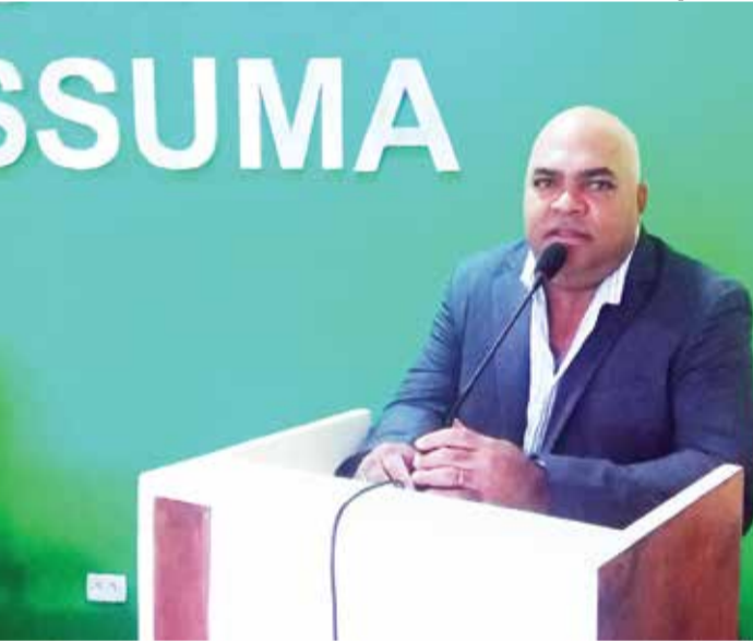
HARMONIA Gea tem bom trânsito com o Executivo

Apesar da população está insatisfeita com a classe política em todas as suas esferas, algumas cidades da Região Norte do Estado têm representantes que se esforçam para apresentar bons trabalhos, tanto do Poder Legislativo quanto no Executivo.