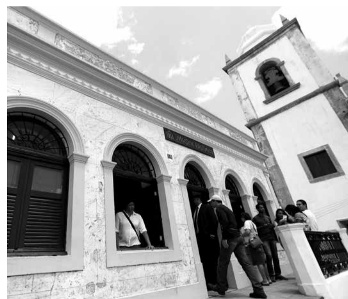
MUSEU HISTÓRICO passou por uma ampla reforma