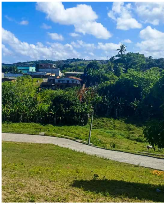
CASA PRÓPRIA O Residence é a melhor opção para ter uma casa planejada, nesse ano de 2023

A cidade de Igarassu destaca-se nesse cenário