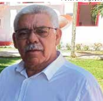
BILO uma boa opção