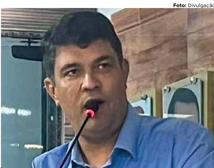
ROMPIMENTO George denunciou perseguição política