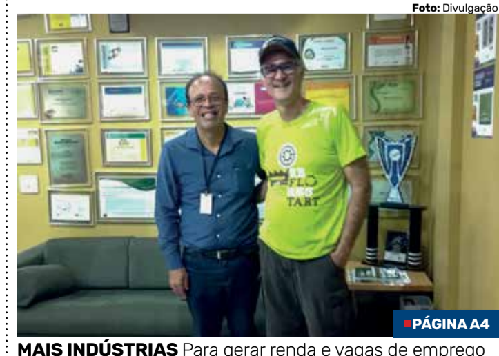
■ PÁGINA A4

MAIS INDÚSTRIAS Para gerar renda e vagas de emprego