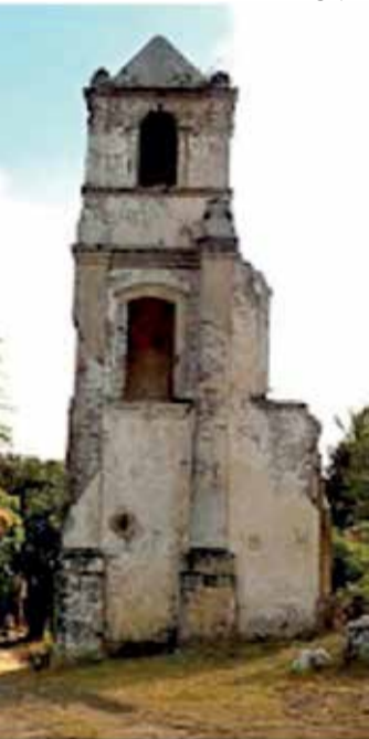
POTENCIAL do turismo ecológico