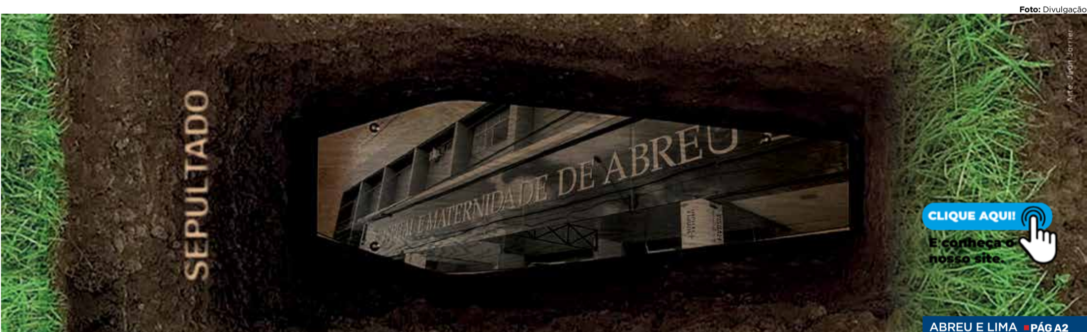
ABREU E LIMA ■ PÁG A2