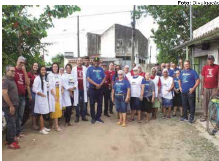
AÇÕES SOCIAIS São direcionadas às pessoas carentes da cidade