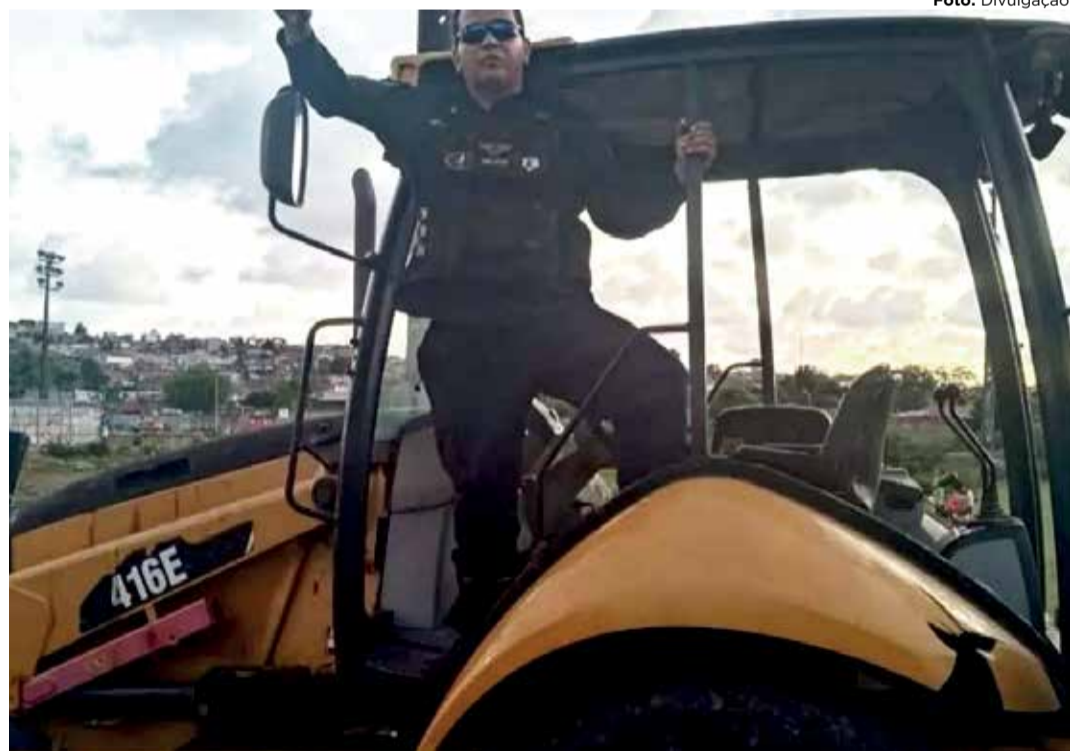
RECUPERADO O trator foi encontrado pela Guarda Municipal de Itapissuma

De acordo com o prefeito, a ação conjunta entre as polícias Civil e Militar, a Polícia Rodoviária Federal (PRF) e a Guarda Municipal foi essencial para o desfecho positivo. Ele elogiou o trabalho coordenado das forças de segurança, ressaltando a importância da colabora-