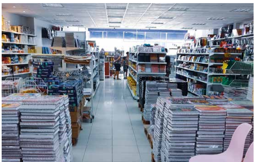
VARIEDADE A loja Baluarte oferece aos seus clientes uma gama de produtos selecionados e de qualidade