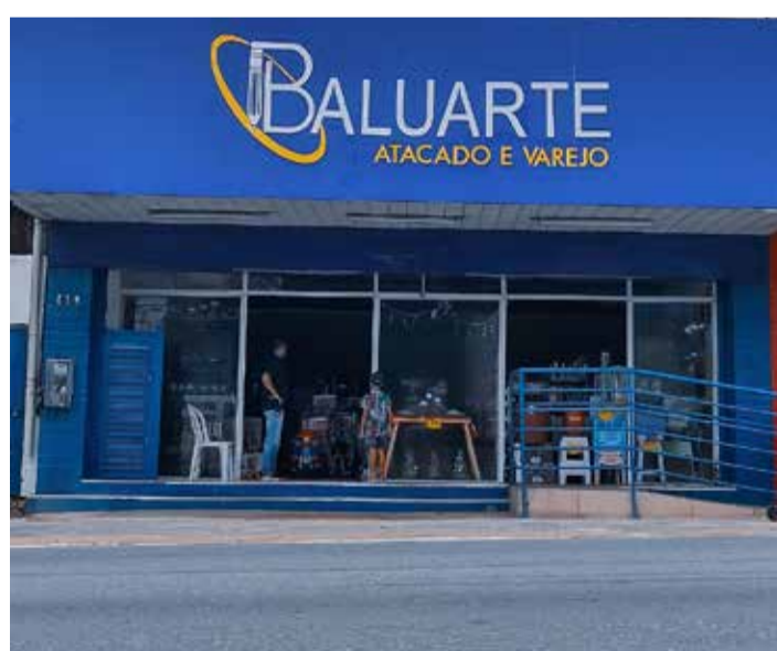
BALUARTE Fica na Avenida Duque de Caxias, no Centro da cidade

A população agora conta com uma opção diversificada e acessível para suas necessidades de material escolar, impulsionando não apenas o comércio, mas também a autoestima e a confiança na prosperidade futura de Abreu e Lima.