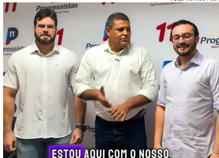
NOVO OLHAR Secretário César Ramos e o vereador Maguila ao lado do deputado federal Lula da Fonte