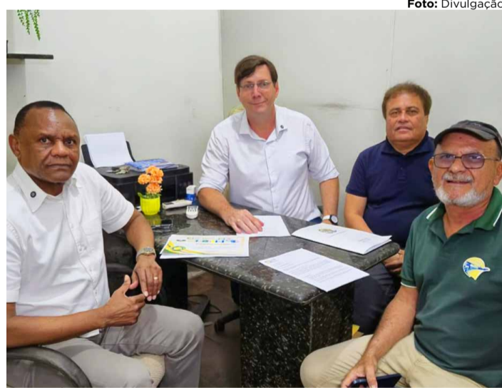
REUNIÃO produtiva para fortalecer o comércio de Igarassu