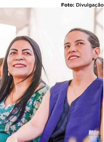
A governadora Raquel Lyra tem intensificado ações

no interior, priorizando segurança, saúde e geração de empregos. O lançamento do programa Juntos Pela Segurança e os investimentos em escolas de tempo integral mostram seu foco em transformar realidades.