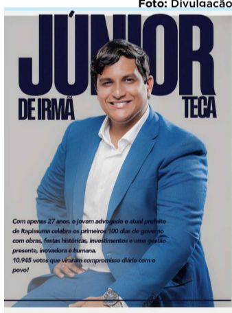
Júnior de Irmã Têca

O prefeito Júnior de Irmã Têca tem se destacado como grande com diversas ações em Itapissuma. Atuante nas comunidades, ele tem priorizado investimentos na educação e na infraestrutura da cidade e atendendo as principais reivindicações da população. Sua atuação fortalece a representatividade do Litoral Norte na política pernambucana.