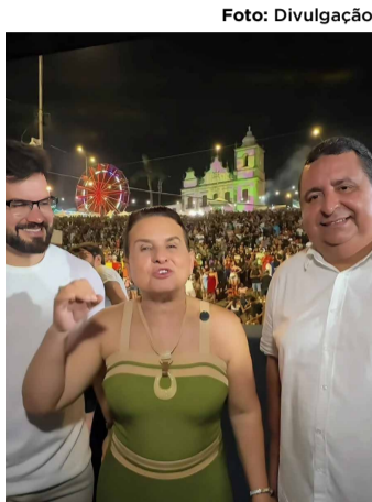
um novo momento de crescimento e organização.

A gestão também tem se destacado pela ampliação dos serviços de saúde e educação. Com uma administração próxima da população, Elcione reforça seu compromisso com o bem-estar dos igarassuenses. A cidade vive