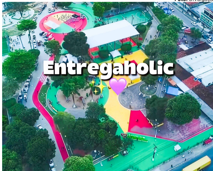
PACOTE DE OBRAS A gestão da prefeita Elcione inaugura várias obras em diversos bairros da cidade, neste ano

Na área da saúde, Elcione ampliou o acesso aos atendimentos básicos, reestruturou unidades, reforçou o programa de atenção à mulher e garantiu o fornecimento regular de medicamentos. A modernização do sistema de marcação de