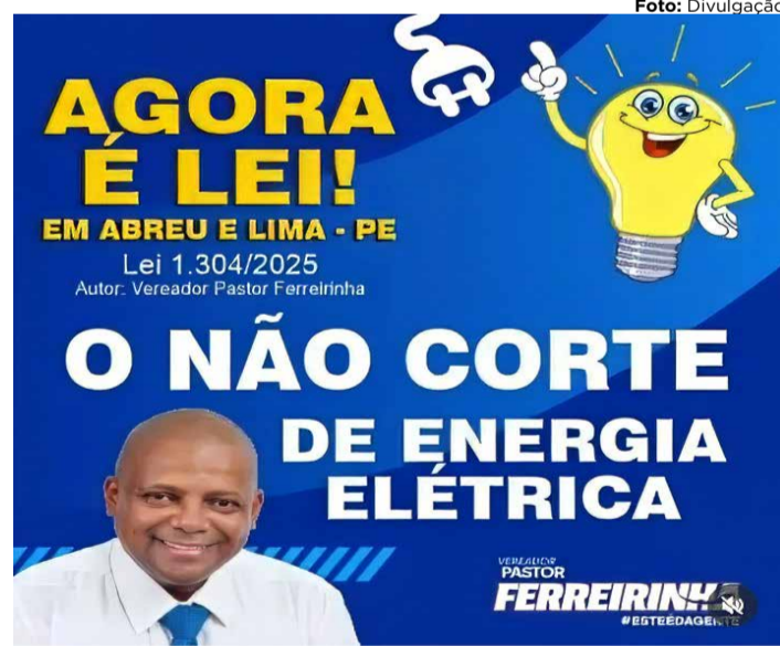
ALCANCE SOCIAL Projeto de Lei foi aprovado na Câmara Municipal

A lei proíbe o corte do fornecimento de energia elétrica por inadimplência a partir das 12h da sexta-