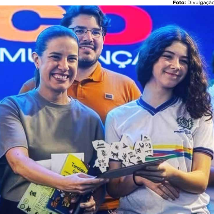
VALORIZAÇÃO A governadora Raquel Lyra sancionou o Projeto de Lei do Piso Salarial dos professores em toda carreira

Por Portal de Prefeitura O Governo de Pernambuco publicou, neste início de abril de 2026, um pacote legislativo que altera diretamente a remuneração e os benefícios do funcionalismo público estadual. A Lei Complementar nº 574/2026 e o Decreto nº 60.423/2026 trazem respostas aguardadas sobre o Piso Nacional do Magistério e a atualização do poder de compra dos servidores através do vale-refeição.